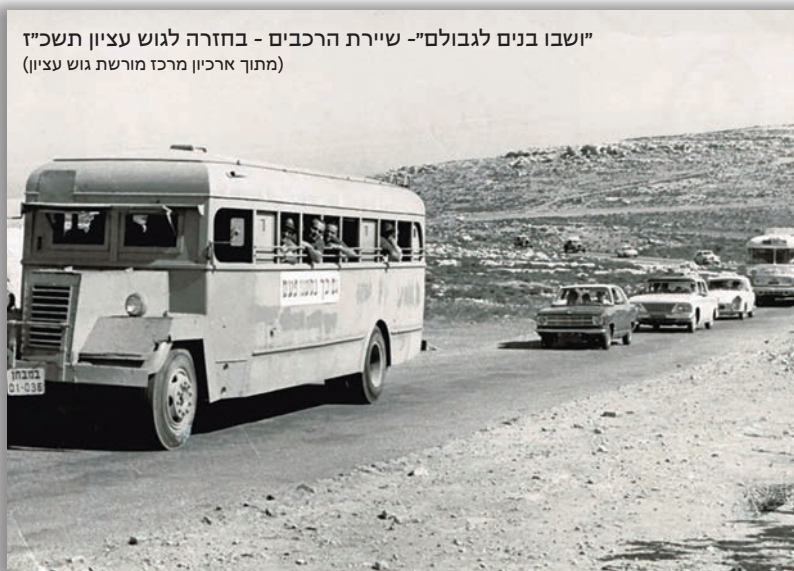
"ישובו בנים לגבולם"- שיירת הרכבים - בחזרה לגוש עציון תשכ"ז

"תארו לכן את כפר עציון בלי הרעש הזה, בלי נשים ובלי ילדים. כפר עציון הרועש ומשגשג על בנייני האבן וגינות הנוי, נראה עכשיו כמחנה צבא מבוצר. כל תשומת ליבנו להתגוננות. אין כל ספק שכל זה, יחד עם הטרגדיה של רצח חברינו, השפיע על רוחנו. אבל אל נא תחשבו שרוחנו נפלה. הרי ידענו מיום עלייתנו לאן אנו הולכים ומה צפוי לנו..." (מתוך "גוש עציון חמישים שנות מאבק ויצירה - יוחנן בן יעקב." עמ' 149)