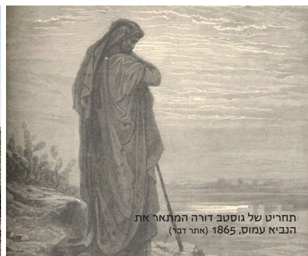
תחריט של גוסטב דורה המתאר את הנביא עמוס, 1865