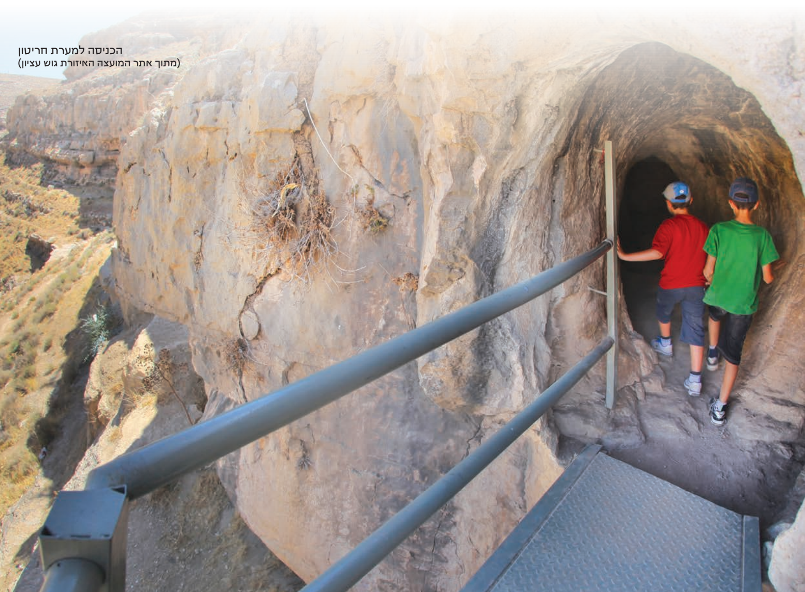
הכניסה למערת חריטון

ניכנס בעזרת סימוני האור והמפה אל החדר הראשון- הגדול, ונתפעל מהחלל העצום שיצרו מי התהום שהמיסו את הסלע. מכאן ניתן להמשיך במספר מסלולים מהנים ומאתגרים במערה, או כמובן לצאת החוצה אל השמש החמימה והמאירה.