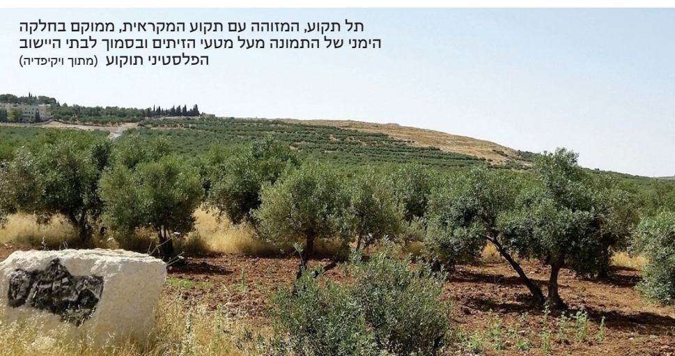
תל תקוע, המזוהה עם תקוע המקראית, ממוקם בחלקה הימני של התמונה מעל מטעי הזיתים ובסמוך לבתי היישוב הפלסטיני תקוע

חז"ל קובעים כי: "סגנון אחד עולה לכמה נביאים, ואין שני נביאים מתנבאים בסיגנון אחד" (בבלי,סנהדרין פט). הנביא הוא שופרו של דבר הא-ל בעולם, אך מולדתו של הנביא ואורח חייו משפיעים על סגנון הדברים, או כמאמרו של שאול טשרנחובסקי "האדם אינו אלא תבנית נוף מולדתו" . עמוס, בהיותו בן ספר המדבר, הושפע מאוד מהגאוגרפיה והאקלים של מקום מגוריו בין ההר למדבר. משלח ידו של עמוס, שהיה כאמור רעיית צאן, מעיד על אחד